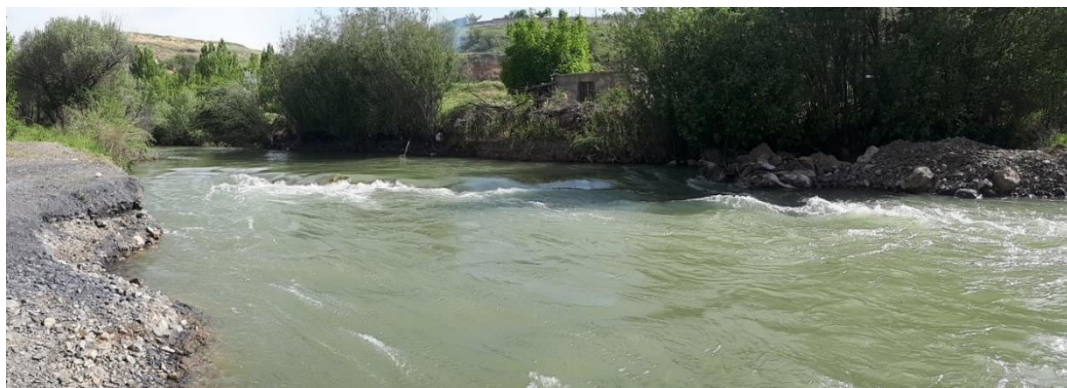
شکل ۲: محل صید گاوماهی تالابی R. similis ، رودخانه قشلاق - پایین دست سد قشلاق.