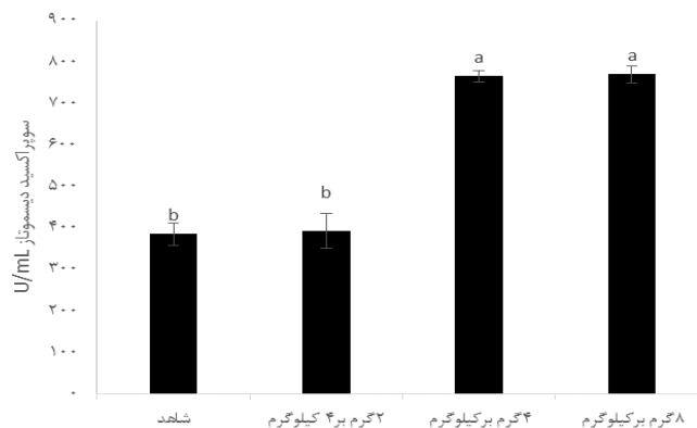
شکل ۱- میزان فعالیت آنزیم سوپراکسید دیسموتاز سرم ماهی قزل‌آلای رنگین‌کمان تغذیه شده با تیمارهای مختلف پست‌بیوتیک بر پایه مخمر ساکارومایسیس سرویزیه