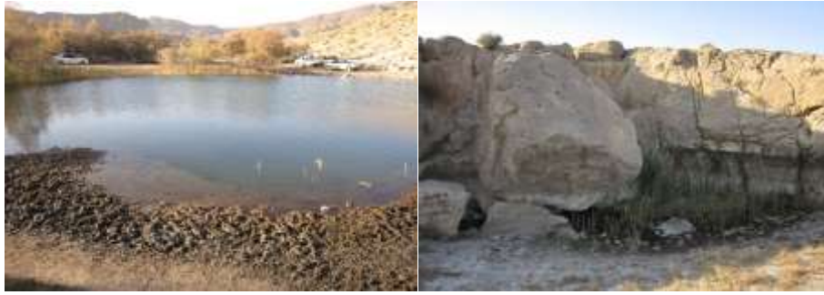
شکل ۵- چشمه تغذیه‌کننده تالاب‌ها (راست) و تالاب جمال‌آبادی (چپ) با کاهش میزان آب در سال ۱۳۹۷.