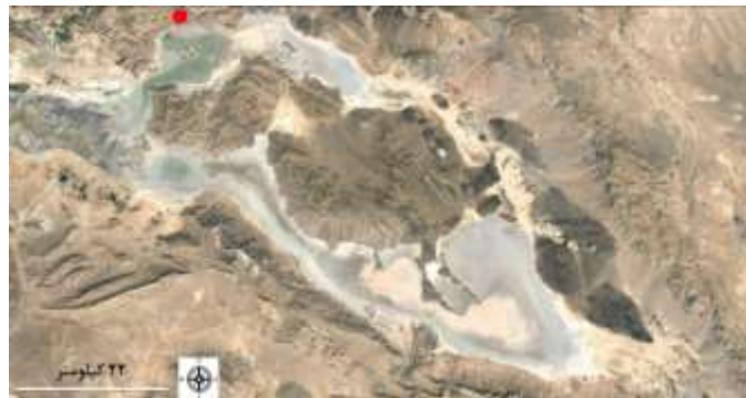
شکل ۱- ب: عکس ماهواره‌ای از وضعیت کنونی تالاب‌های طشک و بختگان (۱۳۹۷) و موقعیت چشمه گمبان (نقطه قرمز).