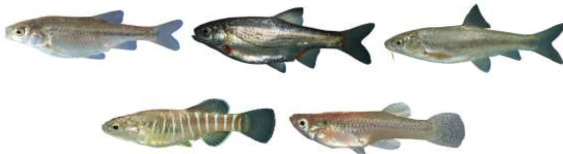
شکل ۴- گونه‌های ماهیان شناسایی شده پیشین (سال ۱۳۸۹)، ساکن تالاب‌های چشمه گمبان، به ترتیب از بالا و چپ و در جهت عقربه‌های ساعت:

Acanthobrama persidis , Alburnoides qanati , Aphanius sophiae (جنس نر)، Capoeta saadii , Gambusia holbrooki .