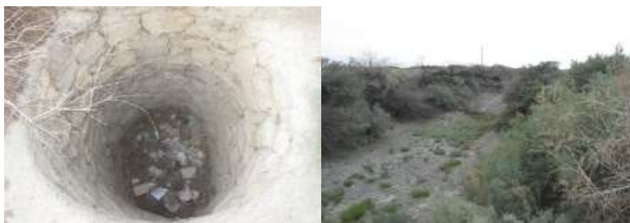
شکل ۱۰- خشک شدن شاخ کربال در محل تلاقی با تالاب بختگان (راست) و پایین رفتن زه آبی منطقه (چپ) پس از احداث سد سیوند. مرداد ۱۳۹۶.