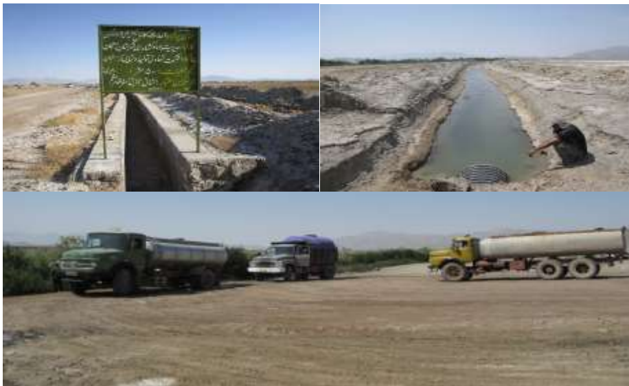
شکل ۷- کانال زه‌کشی آب در کشاورزی (راست، مرداد ۱۳۹۶)، کانال خشک شده زه‌کشی آب پرورش ماهیان خاویاری (چپ، فروردین ۱۳۹۷)، و برداشت آب جهت عملیات راه‌سازی (پایین، اردیبهشت ۱۳۸۹) در منطقه چشمه گمبان.

از سوی دیگر کشاورزان با حفر کانال‌های بزرگ در پایین دست زمین‌های کشاورزی خود، آب‌های شور شده توسط زمین‌های کشاورزی را جمع‌آوری کرده و به سمت تالاب طشک هدایت می‌کنند تا با این کار از شور شدن منابع آبی زمین‌های کشاورزی خود جلوگیری کنند،