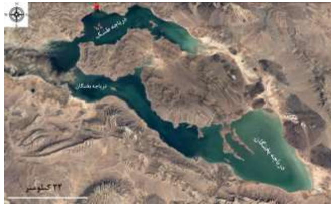
شکل ۱- الف: عکس ماهواره‌ای قدیمی دهه ۸۰ از تالاب‌های طشک و بختگان، و موقعیت چشمه گمبان (نقطه قرمز). عکس از Google earth.

چشمه گمبان (Karnami, 2014; Esmaeili and Teimori, 2016). چشمه گمبان واقع در شمال‌غربی پارک ملی و پناهگاه حیات‌وحش بختگان، دریاچه طشک را تغذیه می‌کند (شکل ۱) و جریان قوی آن برون‌دهی معادل ۲/۵ متر مکعب در ثانیه آب را به طرف دریاچه طشک هدایت می‌کند (Jolaei and Ebrahimi Karnami, 2014) و بنابراین چشمه گمبان و تالاب‌های مجاور آن از مهم‌ترین منابع آبی و حق‌آبه دریاچه طشک در حوضه آبریز کُربال هستند. علی‌رغم غنای بالای گونه‌ای ماهیان آب شیرین در حوضه‌های مختلف آبریز استان فارس، همه این گونه‌ها در تالاب‌ها توانایی زیستن ندارند و یافت نشده‌اند. در توضیح بیشتر، ماهیان آب شیرین توانایی زندگی در آب شور تالاب‌هایی مثل طشک، بختگان از حوضه آبریز کر را ندارند و بنابراین در حق‌آبه‌های این تالاب‌ها (رودخانه‌ها و چشمه‌ها) و یا در محل تلاقی آن‌ها با تالاب‌ها زیست می‌کنند. در این پژوهش، به بررسی تنوع زیستی ماهیان تالاب-های اطراف دریاچه طشک و بختگان و تهدیدات حفاظتی جمعیت‌های آن‌ها در ارتباط با عوامل انسانی و غیرانسانی پرداخته شده است.