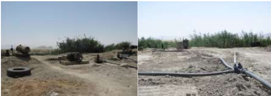
شکل ۶- برداشت بیش از حد مجاز آب جهت کشاورزی و از حق آبه تالاب طشک. مرداد ۱۳۹۶.

جایی که با این کار ضمن کاهش سطح آب تالاب طشک، میزان شوری آب آن را به‌طور مستقیم و غیرمستقیم افزایش می‌دهند (شکل ۷). برداشت آب چشمه گمبان و از حق آبه تالاب جهت عملیات راه‌سازی و دیگر امور زیرساختی نیز بسیار معمول است (شکل ۷).