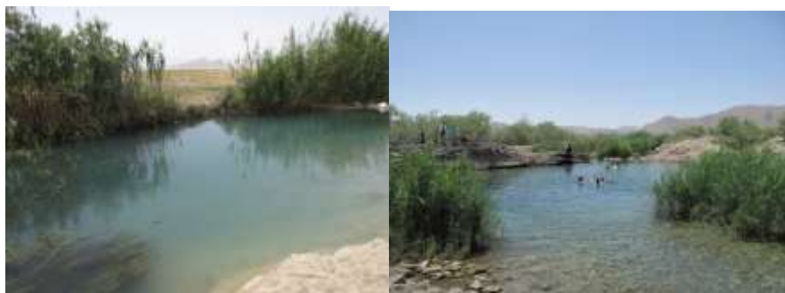
شکل ۲- چشمه گمبان از حق‌آبه‌های دریاچه طشک و در مجاورت دریاچه، حوضه آبریز کر (راست، ۱۳۸۹) و جریان قوی آب آن به سمت دریاچه طشک (چپ، تابستان ۱۳۹۶).