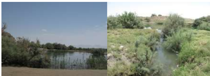
شکل ۳- تالاب دوم (راست) و تالاب جمال‌آبادی (چپ) از تالاب‌های چشمه گمبان. عکس: مرداد ۱۳۹۶.

سرمخروطی پارسی Acanthobrama persidis Coad, 1981، گونه بومزاد ماهی خیاطه قناتی Coad and Bogutskaya, 2009 ، گونه بومزاد سیاه‌ماهی سعدی Capoeta saadii (Heckel, 1847) از خانواده کپورماهیان (Cyprinidae)، گونه بومزاد ماهی گورخری صوفیا Aphanius sophiae (Heckel, 1849) از خانواده کپورماهیان دندان‌دار (Aphaniidae)، و گونه غیربومی گامبوزیا Gambusia holbrooki Girard, 1859 از خانواده گامبوزیاماهیان (Poeciliidae) هستند (شکل ۴).