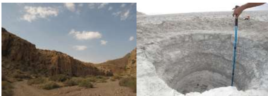
شکل ۹- پایین رفتن زه آب تالاب طشک (راست)، تنگ مقنه سر و خشکیدن چشمه آن، تغذیه کننده تالاب بختگان (چپ). مرداد ۱۳۹۶.