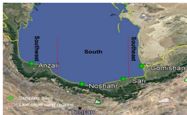
شکل ۱- مکان‌های نمونه‌برداری از ماهیان کپور دریایی

در این مطالعه تعداد ۲۶ نمونه ماهی کپور دریای خزر از تورهای شرکت‌های تعاونی پره ماهیان استخوانی مستقر در سواحل جنوبی دریای خزر در نواحی صیادی استان‌های گلستان (گمیشان)، مازندران (ساری و نوشهر) و گیلان (انزلی) تهیه گردید. همچنین تعداد ۳ نمونه از مراکز تکثیر سیجوال (گلستان) و شهید رجایی (ساری) تهیه گردید. نمونه‌برداری به‌صورت ماهانه از اسفند ماه ۹۶ تا اسفند ماه ۹۷ به‌طول انجامید.