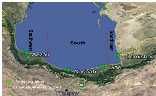
شکل ۱- مکان‌های نمونه‌برداری از ماهیان کپور دریایی

در این مطالعه تعداد ۲۶ نمونه ماهی کپور دریای خزر از تورهای شرکت‌های تعاونی پره ماهیان استخوانی مستقر در سواحل جنوبی دریای خزر در نواحی صیادی استان‌های گلستان (گمیشان)، مازندران (ساری و نوشهر) و گیلان (انزلی) تهیه گردید. همچنین تعداد ۳ نمونه از مراکز تکثیر سیجوال (گلستان) و شهید رجایی (ساری) تهیه گردید. نمونه‌برداری به‌صورت ماهانه از اسفند ماه ۹۶ تا اسفند ماه ۹۷ به‌طول انجامید.