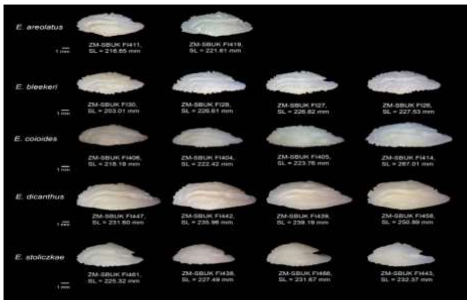
شکل ۳- ریخت‌شناسی مقایسه‌ای اتولیت ساجیتا در گونه‌های مورد مطالعه جنس Epinephelus

در گونه E. coioides حاشیه شکمی فاقد دندان مشخص و دارای زوائد اندک کنگره‌دار (Crenate)، حاشیه پشتی دارای چند دندان (Dentate)، ناحیه Postrostrum صاف و گاهی با کنگره‌های نامنظم، ناحیه اگزیسورا دارای فرورفتگی (Notch) نوک تیز (Acute) و کم عمق (Shallow) می‌باشد. در گونه E. dicanthus حاشیه شکمی تا حدودی صاف و فاقد دندان، حاشیه پشتی دارای دندانه‌ها بزرگ، به صورت نامنظم و تعداد محدود است. دندانه‌های حاشیه پشتی و عقبی اتولیت در اغلب نمونه‌های مطالعه شده این گونه، از نظر شکل و موقعیت قرارگیری شبیه به هم هستند. نحوه قرارگیری شیار سولکوس در ناحیه خط میانی و نوع بازشدگی شیار از نوع دهانی (Ostial)، ناحیه اگزیسورا فاقد فرورفتگی (Notch) است. در گونه E. stoliczkae حاشیه شکمی اتولیت دارای دندانه‌های درشت، نامنظم و حاشیه پشتی دارای زوائد کنگره‌دار (Crenate) و موجی نامنظم می‌باشد. ناحیه اگزیسورا دارای فرورفتگی (Notch) نوک تیز (Acute) و عمیق (Deep) است. طول ناحیه کوادا تقریباً هم اندازه با طول ناحیه اوستیوم می‌باشد.