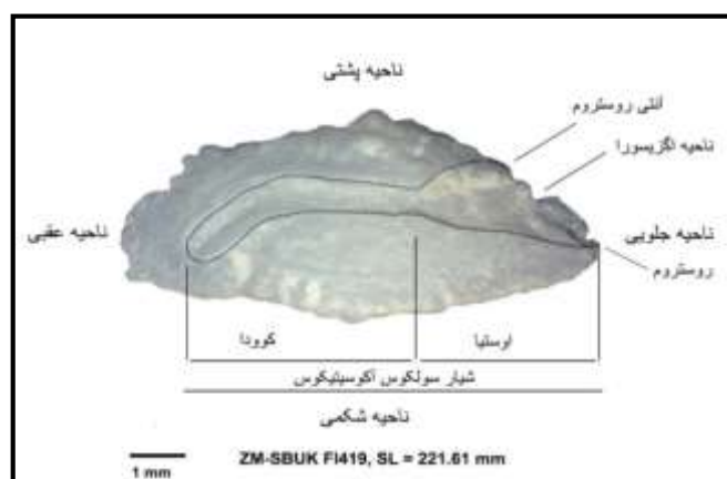
شکل ۱- نمای اتولیت چپ ساژیتا در هامورماهیان (Serranidae) و نام‌گذاری قسمت‌های مختلف آن

تغییرات در ریخت‌شناسی آن تا حدی ناشی از تغییرات ژنتیکی است که در اثر انتخاب طبیعی بوجود آمده است (Teimori et al. , 2012b) که از این تغییرات در تاکسونومی و بازسازی روابط تکاملی ماهیان استفاده می‌شود (Teimori et al. , 2014). از نظر ریختی، هر اتولیت دارای یک روستروم (Rostrum) و آنتی‌روستروم (Antirostum) می‌باشد (شکل ۱). در اتولیت بعضی از گروه‌های ماهیان، روستروم و آنتی‌روستروم کاملاً مشخص بوده، درحالی‌که این ساختارها در گروه‌های دیگر ماهیان ممکن است نامشخص یا وجود نداشته باشد. هر اتولیت همچنین دارای یک فرورفتگی طولی مشخص در قسمت میانی و سطح پروکسیمال است که شیار سولکوس آکوستیکوس خوانده می‌شود. گوناگونی در ویژگی‌های ریختی آن شامل تنوع در شکل کلی، شکل حاشیه‌های پشتی و شکمی، وجود و عدم وجود زائده در حاشیه‌های پشتی و شکمی، موقعیت شیار سولکوس و نحوه باز شده شیار سولکوس در ناحیه جلویی و عقبی اتولیت است (Tuset et al. , 2008). نام‌گذاری قسمت‌های مختلف اتولیت و ویژگی‌های آن در شکل ۱ نشان داده شده است.