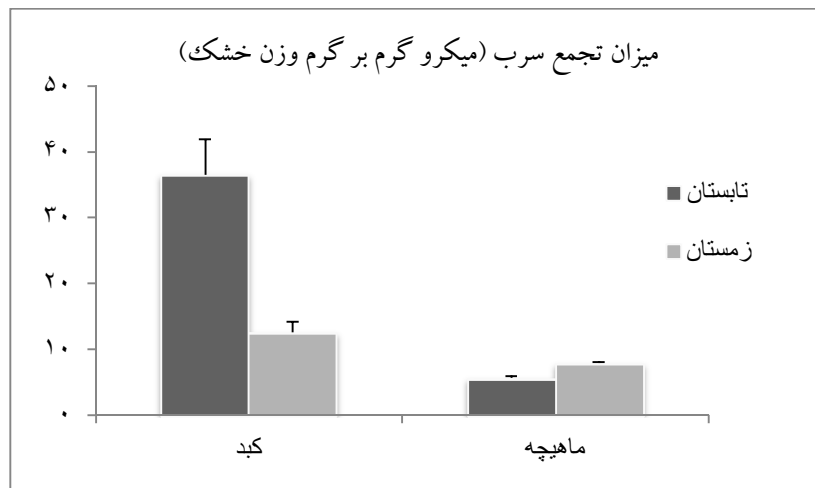
شکل ۱: میانگین غلظت فلز سرب در شانک زرد باله A. latus در تابستان و زمستان ۹۳ در آبهای ساحلی شمال خلیج فارس (استان بوشهر - بندردیلم)