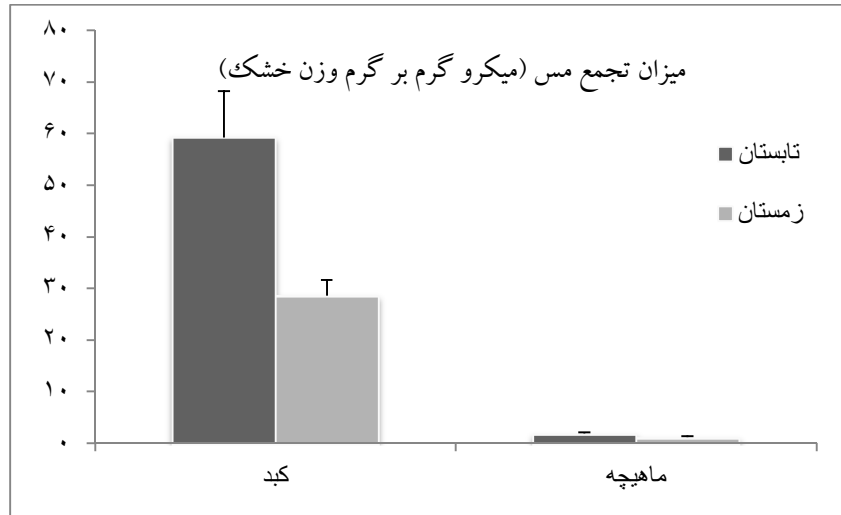
شکل ۳: میانگین غلظت فلز مس در شانک زرد باله A. latus در تابستان و زمستان ۹۳ در آب‌های ساحلی شمال خلیج فارس (استان بوشهر - بندر دیلم)