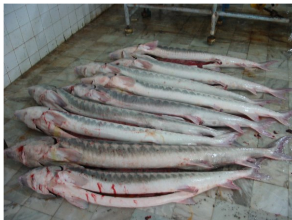
شکل ۱- تاس‌ماهیان ایرانی مورد مطالعه در صیدگاه.

همچنین در این بررسی همان‌گونه که در جدول ۴ آورده شده است، ۶۶/۶۶ درصد از نمونه‌هایی که مورد بررسی قرار گرفتند آلوده به انگل بودند. از ۳۳/۳۳ درصد نمونه‌های مورد بررسی هیچ انگلی جدا نگردید. همچنین در این مطالعه ۴۶/۱۵ از کل نمونه‌های مورد تنها به یک انگل آلوده بودند.