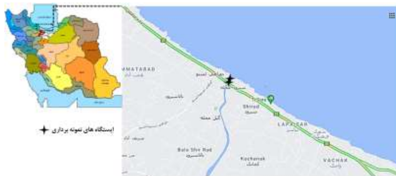
شکل ۱- موقعیت جغرافیایی رودخانه شیروود و ایستگاه‌های نمونه‌برداری

در مطالعه حاضر، به‌منظور بررسی عوامل مؤثر بر کاهش جمعیت مارماهی دهان‌گرد خزری رودخانه شیروود به‌عنوان پایلوت موردتوجه قرار گرفت. رودخانه شیروود از رودخانه‌های شهرستان تنکابن در استان مازندران می‌باشد. این رودخانه از به‌هم پیوستن دو شاخه رودخانه تشکیل می‌شود که شامل رودخانه خشک‌رود و تیرم می‌باشد. طول رودخانه شیروود حدوداً ۳۰ کیلومتر است و از مهم‌ترین زیستگاه‌های مهاجرت ماهیان مانند ماهی سفید ( Rutilus frisii kutum ) و مارماهی دهان‌گرد خزری ( C. wagneri ) محسوب می‌شود (Khara et al., 2009). در مطالعه حاضر، سه ایستگاه در پایین‌دست رودخانه شیروود (پس از پل) برای نمونه‌برداری انتخاب شدند (شکل ۱).