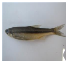
شاه‌کولی A. sellal

به لحاظ فراوانی ۹۹٪ جمعیت ماهیان متعلق به خانواده کپورماهیان بودند (جدول ۱). در مجموع گونه شاه‌کولی ( Alburnus sellal ) با فراوانی ۴۹/۴ درصد از بیش‌ترین درصد فراوانی نسبی برخوردار بود. این گونه هم در دریاچه پشت سد و هم در رودخانه کوماسی از بیش‌ترین فراوانی نسبی برخوردار بود (جدول ۱)، به طوری که درصد فراوانی نسبی آن در دریاچه پشت سد ۵۴/۷ درصد و در رودخانه ۲۷/۳ درصد برآورد شد. تعداد گونه‌های شناسایی شده در هر دو زیستگاه یکسان بوده، ولی به لحاظ حضور و عدم حضور برخی گونه‌ها متفاوت بودند (جدول ۱). در بین گونه‌های ماهیان شناسایی شده، ۵ گونه H. leucisculus ، C. carpio ، C. auratus ، H. molitrix و P. parva برای منطقه مورد مطالعه غیر بومی بودند که