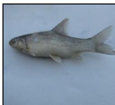
سیاه ماهی توتینی C. trutta