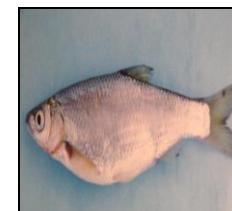
تیز کولی H. leucisculus