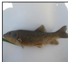
بلیزم B. lacerta