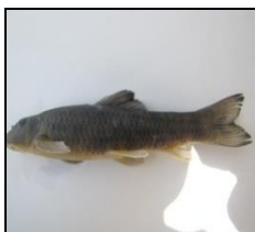
سنگ لیس G. rufa