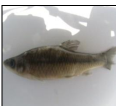
پاروا P. parva