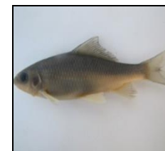
بوتک C. macrostomum