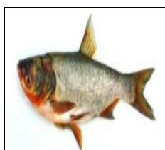
فیتوفاگ H. molitrix