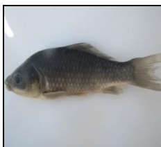
کاراس C. auratus