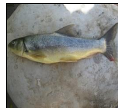
سیاه ماهی سارده C. saadii