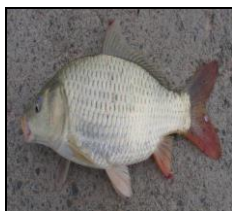
کپور معمولی C. carpio