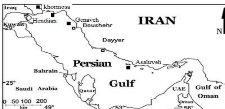
شکل ۱- موقعیت مناطق نمونه‌برداری شده از ماهی شانک زردباله ( A. latus ) در آب‌های ایرانی خلیج فارس

از ۱۲۰ عدد ماهی شانک زردباله صیدشده توسط قایق‌های صیادی صیدگاه‌های بندر دیر و عسلویه (۳۰ نمونه)، بندر بوشهر (۳۰ نمونه)، گناوه (۳۰)، هندیجان (۳۰) و خورموسی (۳۰ نمونه) از زمستان ۸۹ تا بهار ۱۳۹۰ نمونه‌برداری شد (شکل ۱). از هر ماهی به میزان دو تا سه گرم از بافت نرم باله دمی در الکل ۹۰ درصد تثبیت گردید.