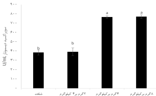
شکل ۱- میزان فعالیت آنزیم سوپراکسید دیسموتاز سرم ماهی قزل‌آلای رنگین‌کمان تغذیه شده با تیمارهای مختلف پست‌بیوتیک بر پایه مخمر ساکارومایسیس سرویزیه