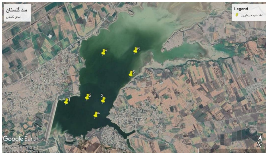
شکل ۱- نمای کلی از سد گلستان و نقاط نمونه‌برداری-استان گلستان

سد مخزنی گلستان در بالادست سد وشمگیر در محدوده دشت گرگان در فاصله ۱۵ کیلومتری شمال شرقی شهرستان گنبدکاووس قرار دارد. این پژوهش با توجه به بررسی‌های اولیه و مورفولوژی سد گلستان تعداد ۷ ایستگاه نمونه‌برداری در موقعیت‌های مختلف (براساس ورودی و اعماق مختلف مخزن دریاچه سد) مشخص شد (شکل ۱). به‌منظور اندازه‌گیری خصوصیات فیزیکی و شیمیایی آب، نمونه‌برداری به‌صورت ماهانه به مدت یک سال از فروردین تا اسفند ماه سال ۱۳۹۸ با استفاده از دستگاه روتنر صورت گرفت. برخی عوامل فیزیکی و شیمیایی از قبیل pH، دما، هدایت الکتریکی (EC) و اکسیژن محلول در محل نمونه-برداری به‌وسیله دستگاه مولتی پارامتر پرتابل مدل HQ30D HACH و سایر عوامل فیزیکی و شیمیایی (شوری، مواد جامد معلق، سختی کل، قلیائیت کل، نیترات، آمونیاک، فسفات و فسفر کل) پس از تهیه نمونه آب و انتقال آن، در آزمایشگاه آنالیز شیمیایی مرکز تحقیقات