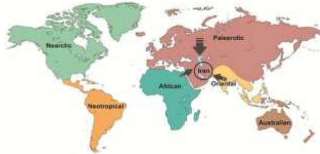
شکل ۱- موقعیت صفحات جغرافیایی مختلف در جهان و سه صفحه متأثر بر ایران (اقتباس شده از Esmaili et al. , 2017)

در مجموع گونه‌های بیشتری دارند، آب‌های شیرین در واحد حجم زیستگاه بسیار غنی‌ترند. تنوع گونه‌های ماهیان آب شیرین بیشتر از تنوع ماهیان دریایی است، درحالی‌که محیط‌های دریایی حدود ۷۰٪ کره زمین و حدود ۹۷٪ از حجم کل آب‌های کره زمین را در برمی‌گیرد (May, 1994; Carrete Vega & Wiens, 2012; Manel et al. , 2020). این تنوع در گونه‌های آب شیرین شاید تعجب‌آور نباشد، زیرا زیستگاه‌های متعدد و متنوعی به‌صورت جداگانه وجود داشته که این تنوع گونه‌ای را تقویت می‌کند (Bone & Moore, 2008). ماهی‌های آب شیرین که تقریباً ۲۵٪ از کل مهره‌داران را تشکیل می‌دهند، یکی از مؤلفه‌های مهم تنوع زیستی جهانی هستند (Reid et al. , 2013). اکوسیستم‌های آب شیرین به دلایل زیادی ارزشمند می‌باشد، زیرا این اکوسیستم خدمات زیادی از جمله آب آشامیدنی، کنترل سیل، تنظیم آب‌وهوا، تولید مواد غذایی را برای انسان فراهم می‌کند (Hitt et al. , 2015). تنوع زیستی در زیستگاه‌های آب شیرین به دلیل جمعیت زیاد انسانی در اطراف این اکوسیستم‌ها به همراه غنای گونه‌های زیاد، به‌ویژه