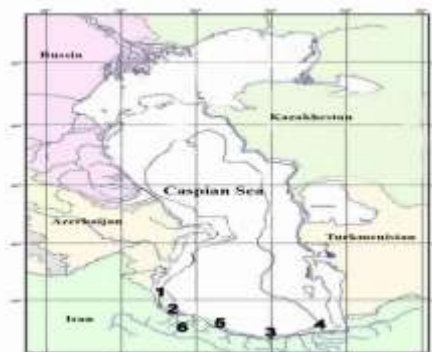
شکل ۱- نقشه مناطق نمونه‌برداری تاس‌ماهی ایرانی