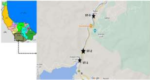
شکل ۱- موقعیت جغرافیایی ایستگاه‌های مورد مطالعه در رودخانه سفیدرود

جهت نمونه‌برداری انتخاب شدند (شکل ۱). در این مطالعه، نمونه-برداری ماهیان با استفاده از دستگاه الکتروشوکر و تور پشتیبان در اردیبهشت‌ماه ۱۳۹۵ انجام شد. بلافاصله پس از نمونه‌برداری، پارامترهای فیزیکوشیمیایی آب شامل دمای آب، قلیائیت (pH)، کل مواد جامد محلول (TDS)، اکسیژن محلول (DO)، نیترات ( \text{NO}_3 ) و فسفات ( \text{PO}_4 ) ثبت گردید. برای اندازه‌گیری دمای آب از دماسنج جیوه‌ای استفاده شد. همچنین، برای اندازه‌گیری پارامترهای pH، TDS از تستر کیفیت آب مدل ۹۹۷۲۰ استفاده شد. مقدار اکسیژن محلول نیز با استفاده از پروب اکسیژن‌متر HANNA و غلظت نیترات و فسفات به روش استاندارد اسپکتروفتومتری اندازه‌گیری شد.