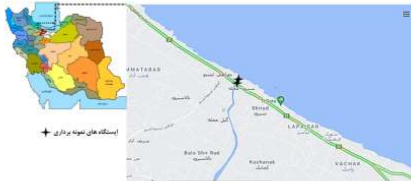
شکل ۱- موقعیت جغرافیایی رودخانه شیروود و ایستگاه‌های نمونه‌برداری

در مطالعه حاضر، به‌منظور بررسی عوامل مؤثر بر کاهش جمعیت مارماهی دهان‌گرد خزری رودخانه شیروود به‌عنوان پایلوت موردتوجه قرار گرفت. رودخانه شیروود از رودخانه‌های شهرستان تنکابن در استان مازندران می‌باشد. این رودخانه از به‌هم پیوستن دو شاخه رودخانه تشکیل می‌شود که شامل رودخانه خشک‌رود و تیرم می‌باشد. طول رودخانه شیروود حدوداً ۳۰ کیلومتر است و از مهم‌ترین زیستگاه‌های مهاجرت ماهیان مانند ماهی سفید ( Rutilus frisii kutum ) و مارماهی دهان‌گرد خزری ( C. wagneri ) محسوب می‌شود (Khara et al., 2009). در مطالعه حاضر، سه ایستگاه در پایین‌دست رودخانه شیروود (پس از پل) برای نمونه‌برداری انتخاب شدند (شکل ۱).