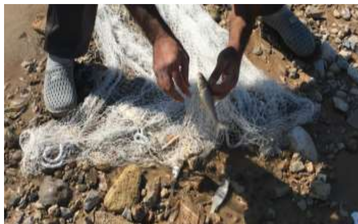
شکل ۲- صید ماهیان توسط تور پرتابی