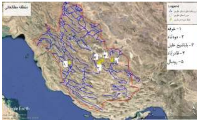
شکل ۱- موقعیت جغرافیایی ایستگاه‌های مورد بررسی بر روی نقشه