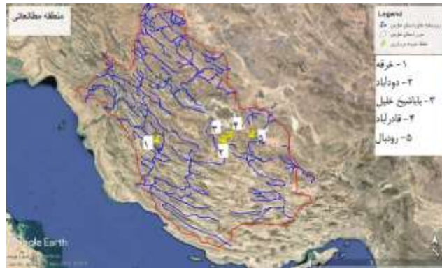
شکل ۱- موقعیت جغرافیایی ایستگاه‌های مورد بررسی بر روی نقشه

لیس، ماهی سنگی اشاره نمود. ماهی گل چراغ یک گونه مهم در بوم سازگان بوده و به پالایش رودخانه‌ها کمک می‌کند (Coad, 2014). همچنین دارای ارزش درمانی در درمان بیماری‌های پوستی می‌باشد (Sayili et al., 2007). در تحقیقات زیادی از خصوصیات مرفومتریکی و مرستیکی برای تشخیص تنوع بین‌گونه‌ای یا درون گونه‌ای استفاده شده است (Solem et al., 2006) و در این رابطه مطالعات گسترده‌ای در داخل کشور بر روی تنوع ریختی ماهی‌ها و از جمله ماهی G. rufa انجام گرفته است (Ghalenoei et al., 2010; Nezameslami et al., 2013; Askari et al., 2014; Mansouri Khajeh Langi et al., 2016; Vesaghi et al., 2017; Ghalenoei et al., 2010). نظر به اهمیت خصوصیات مرفومتریکی درشناسایی و رده‌بندی موجودات، لازم است در مکان‌های مختلف و حتی در زمان‌های مختلف، جمعیت‌های یک گونه ماهی مورد بررسی قرار گیرد. لذا، پژوهش حاضر با هدف بررسی جدایی جمعیت‌های گونه G. Rufa براساس خصوصیات مورفومتریکی در پنج ایستگاه رودخانه رودبال، قنات قادرآباد، قنات