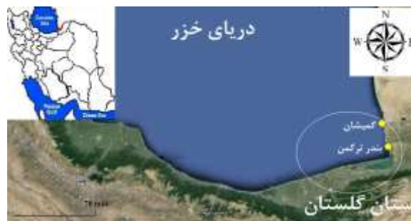
شکل ۱- نقشه منطقه مورد مطالعه در استان گلستان؛ گمیشان و بندر ترکمن، بخش جنوب‌شرقی دریای کاسپین

بوجود این‌که صید غیرمجاز مانع بزرگی در مسیر اجرای سیاست‌های صحیح مدیریت صید و صیادی به‌شمار می‌رود، ولی کمتر به بررسی دلایل وقوع آن پرداخته شده است (Jaric and Gessner, 2012). عوامل متعددی را می‌توان در احتمال وقوع صید غیرمجاز و