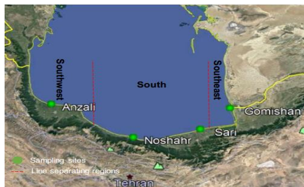
شکل ۱- مکان‌های نمونه‌برداری از ماهیان کپور دریایی

در این مطالعه تعداد ۲۶ نمونه ماهی کپور دریای خزر از تورهای شرکت‌های تعاونی پره ماهیان استخوانی مستقر در سواحل جنوبی دریای خزر در نواحی صیادی استان‌های گلستان (گمیشان)، مازندران (ساری و نوشهر) و گیلان (انزلی) تهیه گردید. همچنین تعداد ۳ نمونه از مراکز تکثیر سیجوال (گلستان) و شهید رجایی (ساری) تهیه گردید. نمونه‌برداری به‌صورت ماهانه از اسفند ماه ۹۶ تا اسفند ماه ۹۷ به‌طول انجامید.