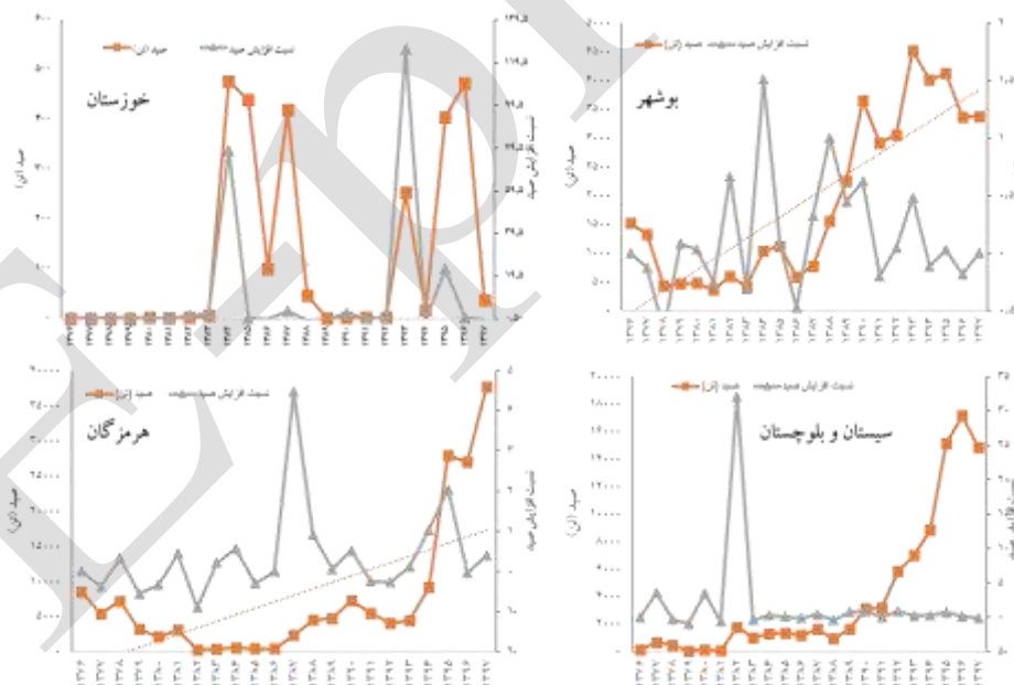
شکل ۲- تغییرات میزان صید، نسبت افزایش صید و روند صید ماهی یال اسبی در آبهای جنوب کشور به تفکیک استان (۱۳۷۶-۱۳۹۷)

است و ماهی یال اسبی به دلیل تراکم محدود در آبهای آن استان صید هدف صیادان آن استان نیست و به همین دلیل ضریب همبستگی روند صید این گونه در آبهای آن استان از لحاظ آماری مهم نیست ( p \geq 0.05 ). در آبهای استان بوشهر میزان صید ماهی یال اسبی سر بزرگ از سال ۱۳۷۶ تا، با ۵۵ درصد افزایش همراه بوده و متوسط رشد