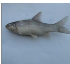
سیاه ماهی توتینی C. trutta