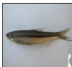
شاه‌کولی A. sellal

به لحاظ فراوانی ۹۹٪ جمعیت ماهیان متعلق به خانواده کپورماهیان بودند (جدول ۱). در مجموع گونه شاه‌کولی ( Alburnus sellal ) با فراوانی ۴۹/۴ درصد از بیش‌ترین درصد فراوانی نسبی برخوردار بود. این گونه هم در دریاچه پشت سد و هم در رودخانه کوماسی از بیش‌ترین فراوانی نسبی برخوردار بود (جدول ۱)، به طوری که درصد فراوانی نسبی آن در دریاچه پشت سد ۵۴/۷ درصد و در رودخانه ۲۷/۳ درصد برآورد شد. تعداد گونه‌های شناسایی شده در هر دو زیستگاه یکسان بوده، ولی به لحاظ حضور و عدم حضور برخی گونه‌ها متفاوت بودند (جدول ۱). در بین گونه‌های ماهیان شناسایی شده، ۵ گونه H. leucisculus ، C. carpio ، C. auratus و H. molitrix و P. parva برای منطقه مورد مطالعه غیر بومی بودند که