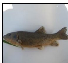
بلیزم B. lacerta