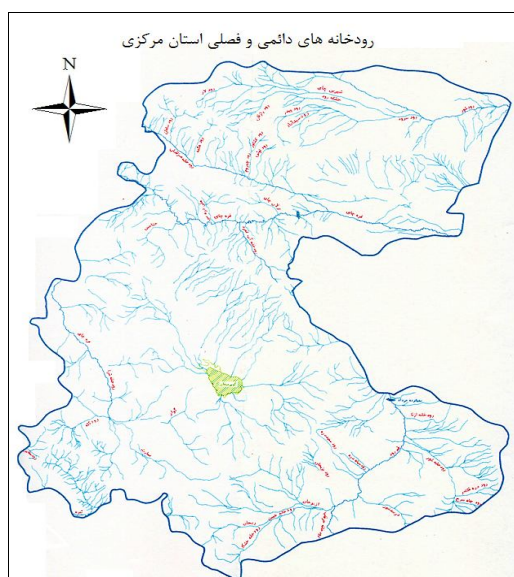
شکل ۲- موقعیت جغرافیایی رودخانه‌های دائمی و فصلی در استان مرکزی

محیط زیست و مناطق تحت مدیریت حفاظت محیط زیست استان: در استان مرکزی ۳۳۵ گونه جانوری شامل ۲۰۵ گونه پرنده، ۵۳ گونه پستاندار، ۵۴ گونه خزنده، ۴ گونه دوزیست و ۱۹ گونه ماهی بومی وجود دارد. جدول ۶ مشخصات و محدوده پراکنش ماهیان بومی در استان مرکزی را نشان می‌دهد. در بین گونه‌های ذکر شده، جمعیت گونه‌های Barbus lacerta , Alburnoides eichwaldii