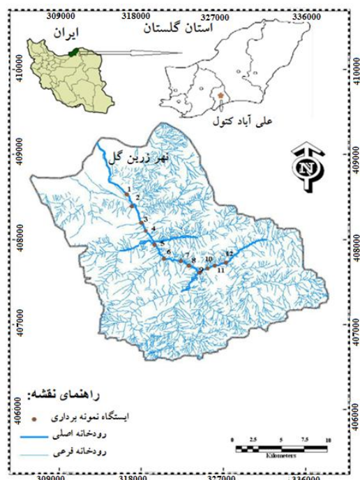
شکل ۱- موقعیت منطقه تحقیقاتی و ایستگاه‌های نمونه‌برداری سگ‌ماهی جویباری ( P. hicanica ) در رودخانه زرین گل

برای بررسی خصوصیات زیستگاهی سگ‌ماهی جویباری در مجموع ۷ متغیر عمق، عرض و شیب رودخانه، ارتفاع از سطح دریا، سرعت جریان آب، ساختار بستر و میزان سایه در نظر گرفته شد. ارتفاع (متر) از سطح دریا در هر ایستگاه، با استفاده از دستگاه موقعیت‌یاب جهانی (GPS) ثبت گردید. شیب نیز در محیط نرم‌افزار ArcGIS 10.3 باتوجه به نقشه آن به‌دست آمد. عمق (متر) در ۲۰ نقطه از هر ایستگاه، به‌طور تصادفی، عمق رودخانه اندازه‌گیری و میانگین آن به‌عنوان متوسط عمق در نظر گرفته شد. عرض خیسی رودخانه (متر) در سه ناحیه ابتدا، وسط و انتهای هر ایستگاه اندازه‌گیری و میانگین آن به‌عنوان متوسط عرض رودخانه برای آن ناحیه در نظر گرفته شد. سرعت جریان (متر بر ثانیه) رودخانه بر اساس روش جسم شناور تخمین زده شد. برای کاهش خطای احتمالی در این روش، در هر ایستگاه اندازه‌گیری سرعت جریان سه بار تکرار شد و میانگین آن به‌عنوان متوسط سرعت جریان رودخانه برای آن ناحیه در نظر گرفته شد. ساختار بستر باتوجه به میزان قطر سنگ‌های غالب بستر رودخانه و اندازه‌گیری قطر ۲۰ سنگ به‌صورت تصادفی براساس (۴ و ۱۲) طبقه‌بندی شد. به‌طوری‌که