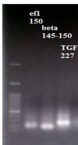
شکل ۱- نتایج ژل الکتروفورز ژنها

روش تجزیه و تحلیل آماری: آزمایش به صورت طرح کاملاً تصادفی با سه تیمار انجام گرفت و داده‌های حاصل از آزمایش با استفاده از برنامه SAS و رویه GLM تجزیه واریانس و مقایسه میانگین با آزمون چند دامنه‌ای دانکن در سطح احتمال ۰/۰۵ انجام شد.