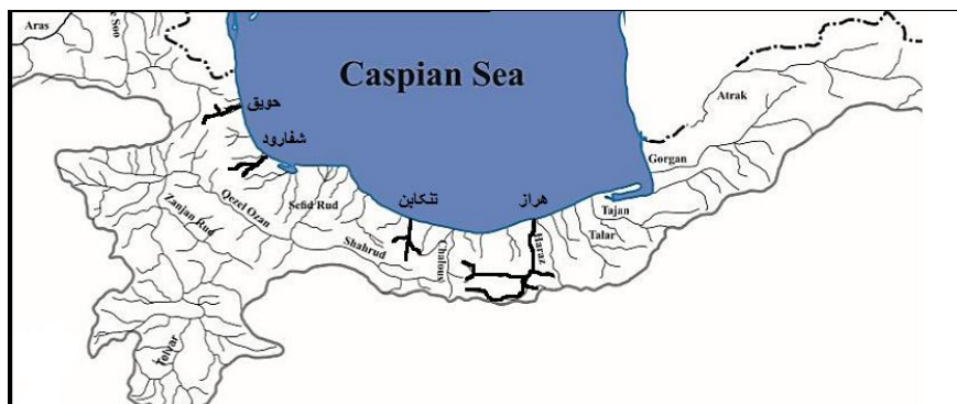
شکل ۱- موقعیت تقریبی رودخانه‌های مورد مطالعه بررسی اولویت غذایی ماهی قزل آلی خال قرمز ( Salmo trutta ) در بخش جنوبی دریای خزر (نگارندگان)

جهت شناسایی طعمه‌های مصرفی از منابع مربوطه (Ahmadi and Nafisi, 2003; Bershtein et al. , 1968; Abdoli, 2000; Merritt et al. , 2008) استفاده شد. درصد خالی بودن معده یا شاخص تهی بودن معده با استفاده از معادله CV = Es / Ts * 100 تعیین شد (Euzen, 1987) که در آن CV شاخص خالی بودن معده، ES تعداد معده‌های خالی بررسی شده و TS تعداد کل معده‌های بررسی شده است. طول نسبی لوله گوارش با استفاده از فرمول طول کل بدن / طول لوله گوارش = RLG محاسبه گردید (Al-Hussainy, 1949). جهت تعیین شاخص پری لوله گوارش (GSI) وزن لوله گوارش پر به وزن بدن ماهی تقسیم و در عدد ۱۰۰ ضرب شد (Biswas, 1993). شاخص شدت تغذیه از معادله IF = (w/W) * 10000 محاسبه گردید (Shorygin, 1952) که IF شدت تغذیه، w وزن محتویات روده به گرم و W وزن ماهی به گرم می‌باشد. فراوانی وقوع یا مشاهده از معادله FP = Ni / Ns * 100 محاسبه گردید که در آن FP فراوانی مشاهده غذای خاص به درصد، Ni تعداد لوله گوارش‌هایی است که این طعمه در آنها دیده شده و Ns تعداد لوله گوارش‌های محتوی غذا می‌باشد. حال اگر F.P < 10 باشد، طعمه خورده شده تصادفی، اگر 10 < F.P < 50 باشد، طعمه خورده شده به‌عنوان یک غذای دسته دوم یا فرعی و اگر F.P > 50 باشد، طعمه خورده شده غذای اصلی ماهی محسوب می‌گردد. جهت تفاوت آماری وزن بدن، طول کل و شاخص‌های طول نسبی لوله گوارش، پری لوله گوارش و شدت تغذیه بین رودخانه‌های مورد بررسی از آزمون کروסקال-والیس در سطح اطمینان ۵ درصد استفاده شد (Zar, 1984).