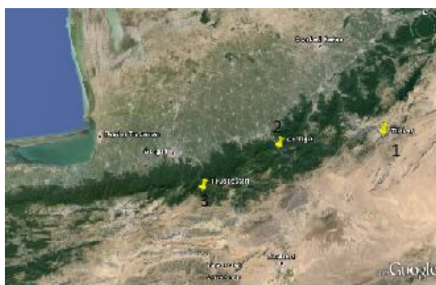
شکل ۱- مناطق نمونه‌برداری سگ‌ماهی جویباری P. hircanica (۱: تیل‌آباد، ۲: زرین‌گل و ۳: توسکستان)

جمع‌آوری نمونه‌ها: سگ‌ماهیان جویباری P. hircanica از رودخانه‌های زرین‌گل، تیل‌آباد و توسکستان واقع در استان گلستان (شکل ۱) با استفاده از دستگاه الکتروشوکر با جریان ۲۰۰-۳۰۰ ولت جمع‌آوری و براساس کلیدهای شناسایی معتبر برای گونه مورد نظر (Coad, 2014) شناسایی شدند. حدود ۲-۳ گرم از باله دمی یا سینه‌ای هر ماهی (۲۸ قطعه ماهی برای هر منطقه مورد بررسی) جدا شده و در ظروف نمونه‌گیری حاوی الکل اتیلیک ۹۶ درصد قرار داده شدند. در نهایت نمونه‌ها جهت انجام آزمایشات مولکولی به آزمایشگاه بیوتکنولوژی آبزیان دانشکده شیلات دانشگاه علوم کشاورزی و منابع طبیعی گرگان انتقال داده شدند.