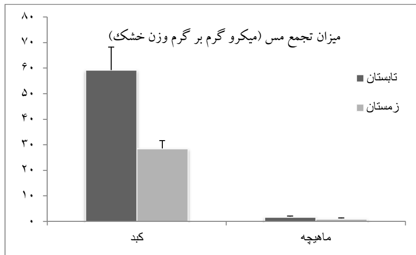
شکل ۳: میانگین غلظت فلز مس در شانک زرد باله A. latus در تابستان و زمستان ۹۳ در آب‌های ساحلی شمال خلیج فارس (استان بوشهر - بندر دیلم)