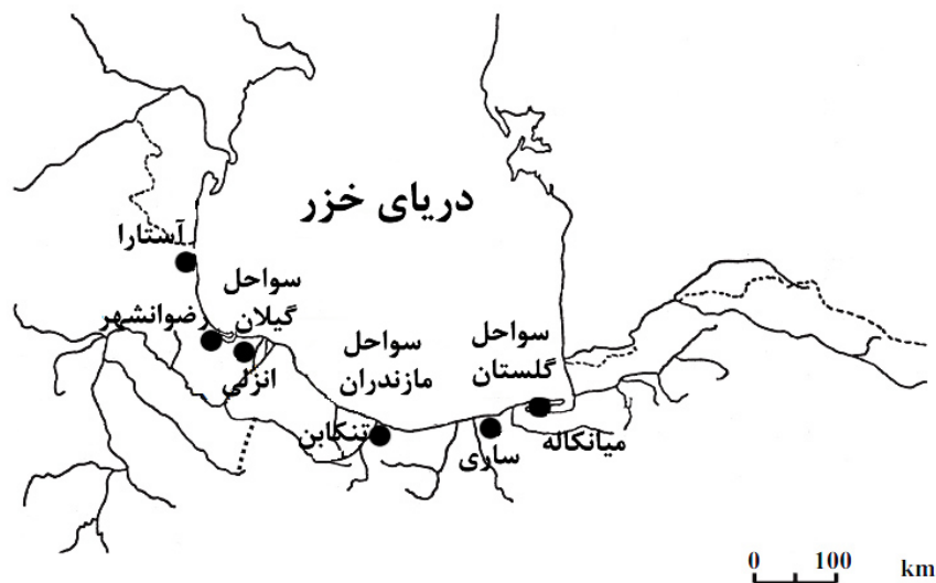
شکل ۱- نقشه موقعیت مناطق مورد مطالعه در حوضه جنوبی دریای خزر

در این مطالعه برای بررسی جمعیت شگ‌ماهیان حوضه جنوبی دریای خزر، از روش‌های ریخت‌سنجی سنتی استفاده شد. برای تعیین تنوع ریختی بین ۶ ایستگاه، ۳۳ صفت ریختی و ۱۰ فاکتور شمارشی مورد بررسی قرار گرفت. متغیرهای وابسته به طول شامل طول کل، طول چنگالی، طول استاندارد، ارتفاع بدن، عرض بدن، ارتفاع ساقه دم، طول سر، عرض سر، ارتفاع سر، طول پوزه، قطر چشم، فاصله پشت چشم تا انتهای سرپوش آبشش، فاصله بین دو حدقه چشم، فاصله ابتدای باله پشتی تا نوک پوزه، فاصله انتهای باله پشتی تا انتهای باله دم، فاصله نوک پوزه تا ابتدای باله مخرجی، فاصله انتهای باله مخرجی تا ابتدای باله دم، فاصله نوک پوزه تا ابتدای باله شکمی، فاصله انتهای باله شکمی تا ابتدای باله دم، طول باله پشتی، ارتفاع باله پشتی، قاعده باله پشتی، طول باله مخرجی، قاعده باله مخرجی، ارتفاع باله مخرجی، طول باله شکمی، طول باله سینه‌ای، فاصله ابتدای باله لگنی تا ابتدای باله سینه‌ای، فاصله ابتدای باله پشتی تا ابتدای باله مخرجی، فاصله ابتدای باله لگنی تا ابتدای باله مخرجی، فاصله ابتدای باله مخرجی تا انتهای باله پشتی، قطر ساقه دم و انتهای باله مخرجی تا ابتدای باله دم به وسیله کولیس دیجیتالی با دقت یک صدم میلی‌متر اندازه‌گیری شدند و صفات شمارشی شامل تعداد خارهای باله پشتی، تعداد شعاع‌های نرم باله پشتی، تعداد خارهای باله مخرجی، تعداد شعاع‌های نرم باله مخرجی، تعداد شعاع‌های نرم باله شکمی سمت چپ، تعداد خارهای باله شکمی سمت چپ، تعداد شعاع‌های نرم باله سینه‌ای سمت چپ، تعداد خارهای باله سینه‌ای سمت چپ و تعداد خارهای آبششی خارجی در زیر لوپ