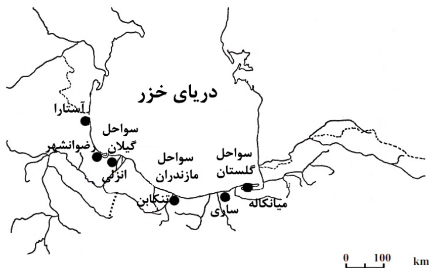
شکل ۱- نقشه موقعیت مناطق مورد مطالعه در حوضه جنوبی دریای خزر

در این مطالعه برای بررسی جمعیت شگ‌ماهیان حوضه جنوبی دریای خزر، از روش‌های ریخت‌سنجی سنتی استفاده شد. برای تعیین تنوع ریختی بین ۶ ایستگاه، ۳۳ صفت ریختی و ۱۰ فاکتور شمارشی مورد بررسی قرار گرفت. متغیرهای وابسته به طول شامل طول کل، طول چنگالی، طول استاندارد، ارتفاع بدن، عرض بدن، ارتفاع ساقه دم، طول سر، عرض سر، ارتفاع سر، طول پوزه، قطر چشم، فاصله پشت چشم تا انتهای سرپوش آبشش، فاصله بین دو حدقه چشم، فاصله ابتدای باله پشتی تا نوک پوزه، فاصله انتهای باله پشتی تا انتهای باله دم، فاصله نوک پوزه تا ابتدای باله مخرجی، فاصله انتهای باله مخرجی تا ابتدای باله دم، فاصله نوک پوزه تا ابتدای باله شکمی، فاصله انتهای باله شکمی تا ابتدای باله دم، طول باله پشتی، ارتفاع باله پشتی، قاعده باله پشتی، طول باله مخرجی، قاعده باله مخرجی، ارتفاع باله مخرجی، طول باله شکمی، طول باله سینه‌ای، فاصله ابتدای باله لگنی تا ابتدای باله سینه‌ای، فاصله ابتدای باله پشتی تا ابتدای باله مخرجی، فاصله ابتدای باله لگنی تا ابتدای باله مخرجی، فاصله ابتدای باله مخرجی تا انتهای باله پشتی، قطر ساقه دم و انتهای باله مخرجی تا ابتدای باله دم به وسیله کولیس دیجیتالی با دقت یک صدم میلی‌متر اندازه‌گیری شدند و صفات شمارشی شامل تعداد خارهای باله پشتی، تعداد شعاع‌های نرم باله پشتی، تعداد خارهای باله مخرجی، تعداد شعاع‌های نرم باله مخرجی، تعداد شعاع‌های نرم باله شکمی سمت چپ، تعداد خارهای باله شکمی سمت چپ، تعداد شعاع‌های نرم باله سینه‌ای سمت چپ، تعداد خارهای باله سینه‌ای سمت چپ و تعداد خارهای آبششی خارجی در زیر لوپ