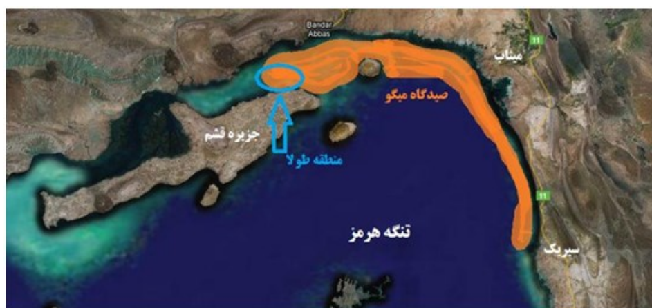
شکل ۱- صیدگاه میگو در منطقه بندرعباس.

نمونه‌برداری در صیدگاه میگو استان هرمزگان در محدوده اطراف جزیره قشم به سمت جزیره قشم انجام شد. نمونه‌برداری در آبان ماه سال ۱۳۸۹ به وسیله لنج چوبی مجهز به تور ترال میگو (با اندازه چشمه کشیده ۲ سانتی‌متر در کیسه تور) انجام شد. قدرت موتور شناور ۴۵۰ اسب بخار بود. ۱۶ تور اندازه‌گیری انجام شد و از میان گونه‌های به دام افتاده سه گونه اقتصادی سنگسر، شوریده و حلوا سفید به دام افتاده جداسازی شدند. نمونه‌های به دام افتاده از صید جدا شده و بر روی عرشه، طول کل و چنگالی نمونه‌ها با دقت ۰/۱ میلی‌متر اندازه‌گیری شد. جهت دستیابی به LM50 گونه‌ها از منابع در دسترس استفاده شد. بر طبق منابع در آب‌های استان هرمزگان، LM50 گونه سنگسر برابر با ۴۴۰ میلی‌متر طول کل، شوریده ۳۳۷ میلی‌متر طول کل (Kamali et al., 2004) و حلوا سفید ۲۴۸ میلی‌متر طول چنگالی بود (Momeni and Kamrani, 2006). از آزمون کای اسکور جهت ارزیابی نرمال بودن یا نبودن داده‌ها استفاده شد.