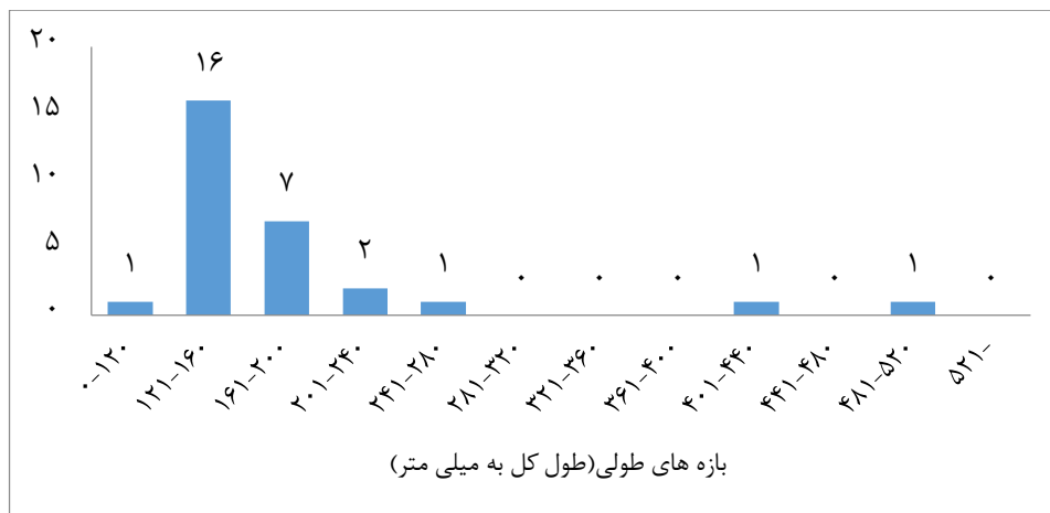
شکل ۲- فراوانی بازه‌های طولی در ماهی سنگسر به دام افتاده