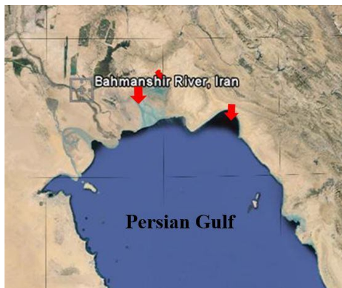
شکل ۱- موقعیت جغرافیایی ایستگاه‌های نمونه برداری ماهی صبور ( T. ilisha ) در منطقه مورد مطالعه

صید ماهی صبور در ایستگاه آب شیرین توسط قایق صیادی محلی صورت گرفت. در ایستگاه آب شور نیز نمونه برداری از ماهی توسط قایق‌های صیادی از بندر سجافی در ۳۰ کیلومتری شهرستان هندیجان صورت گرفت (شکل ۱ و جدول ۱). ماهیان مورد نظر در هر دو ایستگاه با تور گوشگیر با اندازه چشمه ۸۰ میلی‌متر صید شدند. پس از صید و بیهوش نمودن، وزن (گرم) و طول (میلی‌متر) ماهیان به ترتیب توسط ترازو و تخته بیومتری اندازه‌گیری و ثبت شد. پس از باز نمودن شکم ماهی و تشخیص ماهیان نر، قطعاتی از بافت گناد ماهی (بیضه) با اندازه تقریبی ۱ سانتی‌متر مکعب برداشته شد. این قطعات بافتی مربوط به هر قطعه ماهی به صورت جداگانه جهت تثبیت برای انجام سنجش‌های بافتی در محلول بوئن (با نسبت‌های معادل ۷۵ میلی‌لیتر اسید پیکریک اشباع، ۲۵ میلی‌لیتر فرمالدهید خالص و ۵ میلی‌لیتر اسید استیک گلاسیال) قرار داده شد. نمونه‌های موجود در محلول بوئن پس از ۴۸ ساعت (تکمیل فرایند تثبیت) جهت نگهداری تا زمان شروع مطالعات بافتی در الکل ۷۰ درصد قرار داده شد (Movahedinia et al. , 2012).