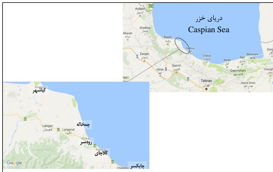
شکل ۱- ایستگاه‌های نمونه‌برداری جنس Alosa در سواحل جنوب غربی دریای خزر (گیلان)